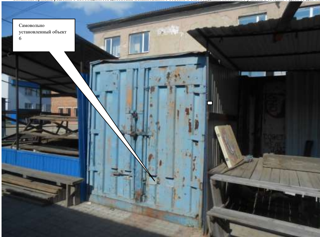
Самовольно установленный объект 6

Комиссия приняла решение о необходимости демонтажа некапитального объекта и освобождении земельного участка в течение 7 дней со дня опубликования.