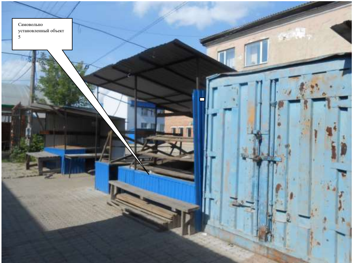
Самовольно установленный объект 5

Информация о факте выявления самовольно установленного некапитального временного объекта по адресу: г. Канск, ул. Московская, 84Б (объект 6)