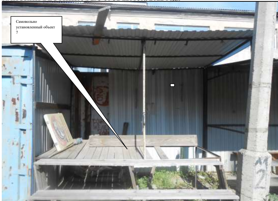
Информация о факте выявления самовольно установленного некапитального временного объекта по адресу: г. Канск, ул. Московская, 84Б (объект 8)