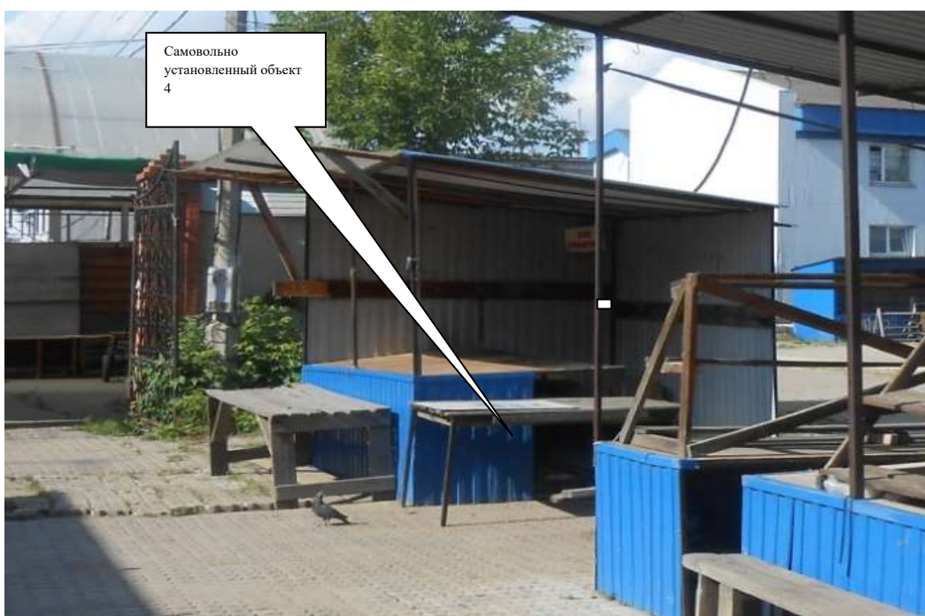
Информация о факте выявления самовольно установленного некапитального временного объекта по адресу: г. Канск, ул. Московская, 84Б (объект 5)

Комиссия приняла решение о необходимости демонтажа некапитального объекта и освобождении земельного участка в течение 7 дней со дня опубликования.