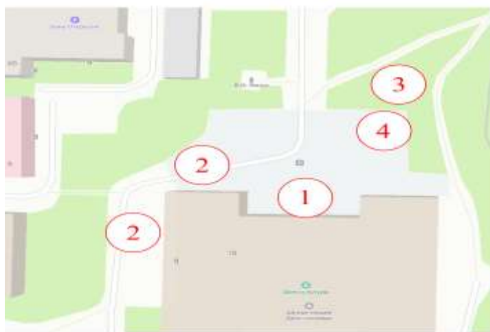
Схема расположения площадок у ГДК г. Канска

Приложение №4 к Постановлению администрации г. Канска от 15.08.2022 г. № 913