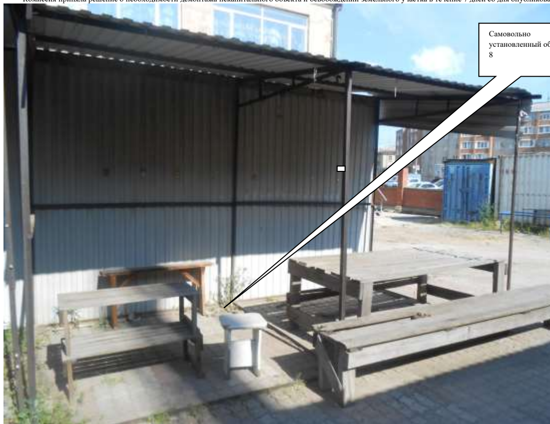
Информация о факте выявления самовольно установленного некапитального временного объекта по адресу: г. Канск, ул. Московская, 84Б (объект 9)

Комиссия приняла решение о необходимости демонтажа некапитального объекта и освобождении земельного участка в течение 7 дней со дня опубликования.