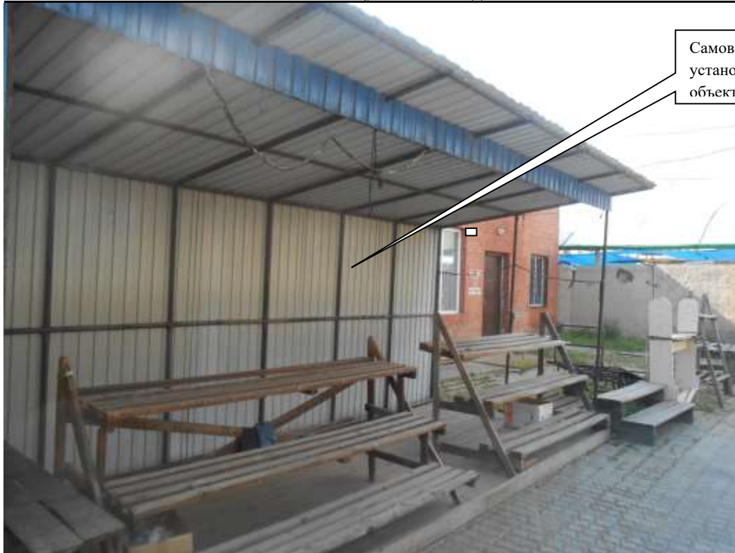
Информация о факте выявления самовольно установленного некапитального временного объекта по адресу: г. Канск, ул. Московская, 84Б (объект 4)