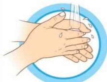
ЧАСТО МОЙТЕ РУКИ С МЫЛОМ