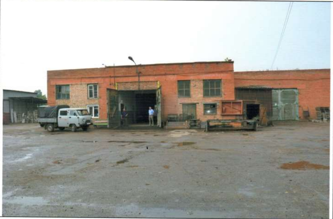
Внешний вид первичного объекта недвижимости