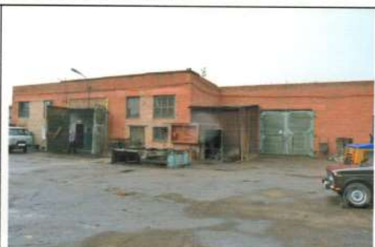
Внешний вид первичного объекта недвижимости