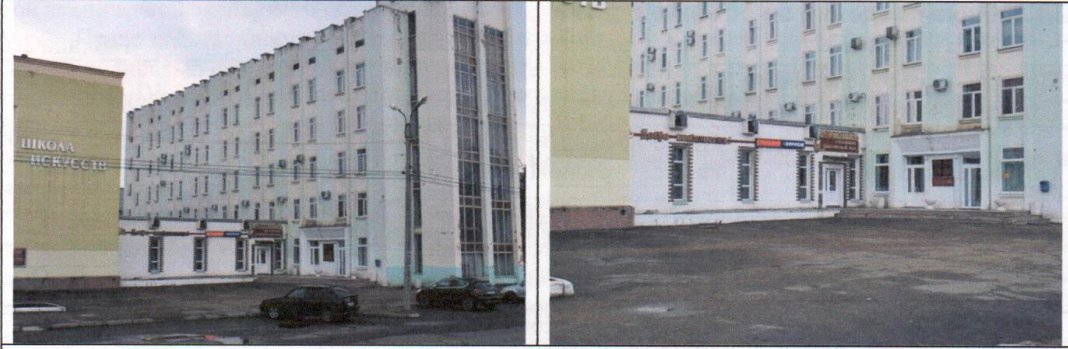
Внешний вид первичного объекта недвижимости