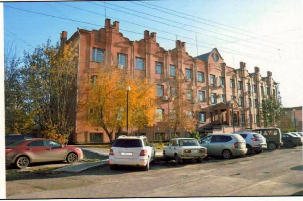
Внешний вид первичного объекта недвижимости