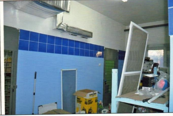
Помещения в попольном этаже