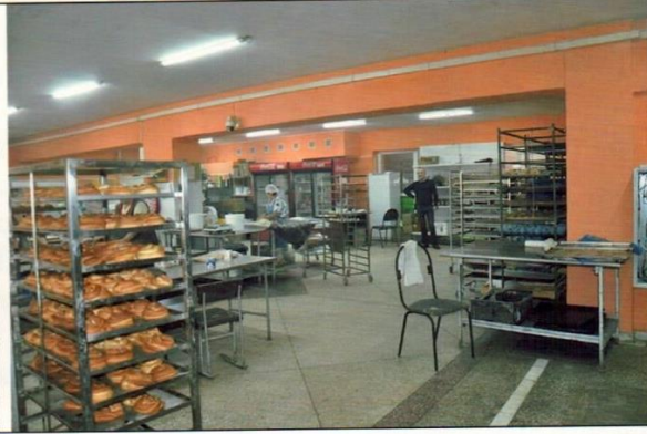
Помещение на 1 этаже