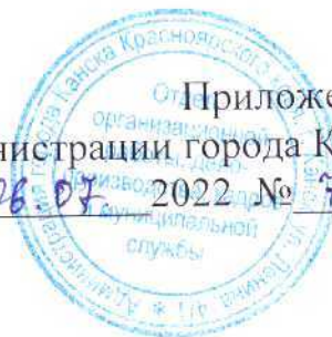
СХЕМА ТЕПЛОСНАБЖЕНИЯ ГОРОДА КАНСКА НА ПЕРИОД С 2013 ГОДА ДО 2028 ГОДА АКТУАЛИЗАЦИЯ НА 2023 ГОД

Приложение 1 к постановлению администрации города Канска от 06.07 2022 № 736