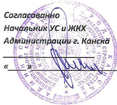
График движения коммерческих автобусов по регулярным автобусным маршрутам г. Канска

Маршрут № 25 Ж.Д.Вокзал – м-н-Солнечный-п.Черемушки