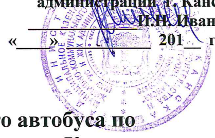
График движения муниципального автобуса по регулярному автобусному маршруту г. Канска